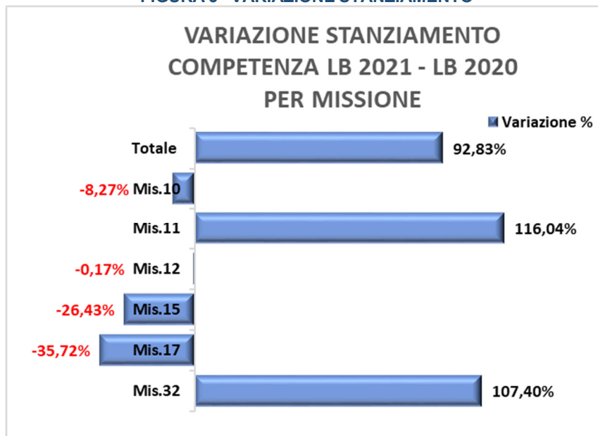
FIGURA 3 –VARIAZIONE STANZIAMENTO