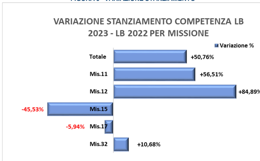
FIGURA 3 –VARIAZIONE STANZIAMENTO

FONTE: Legge di Bilancio 2023 e Legge di Bilancio 2022(stanziamenti di competenza)